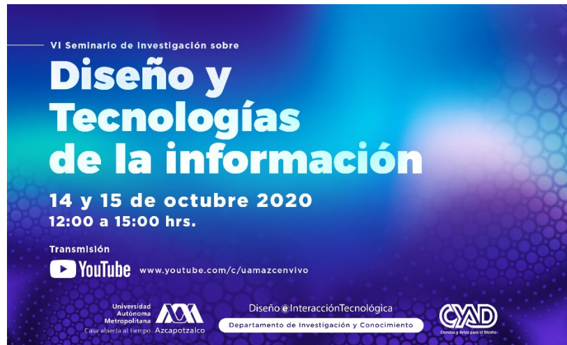
1. Banner para página web y redes sociales

Difusión. Carteles y banners de difusión, programa y captura de pantalla de la página electrónica de UAM Azcapotzalco.