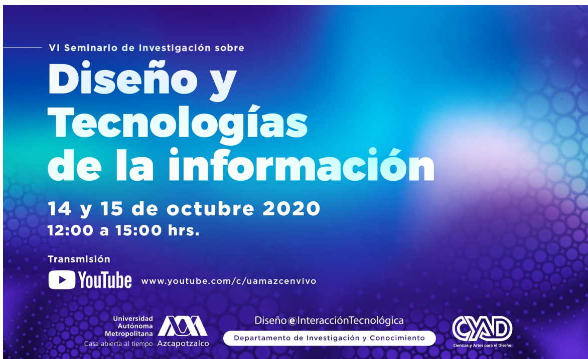
1. Banner para página web y redes sociales