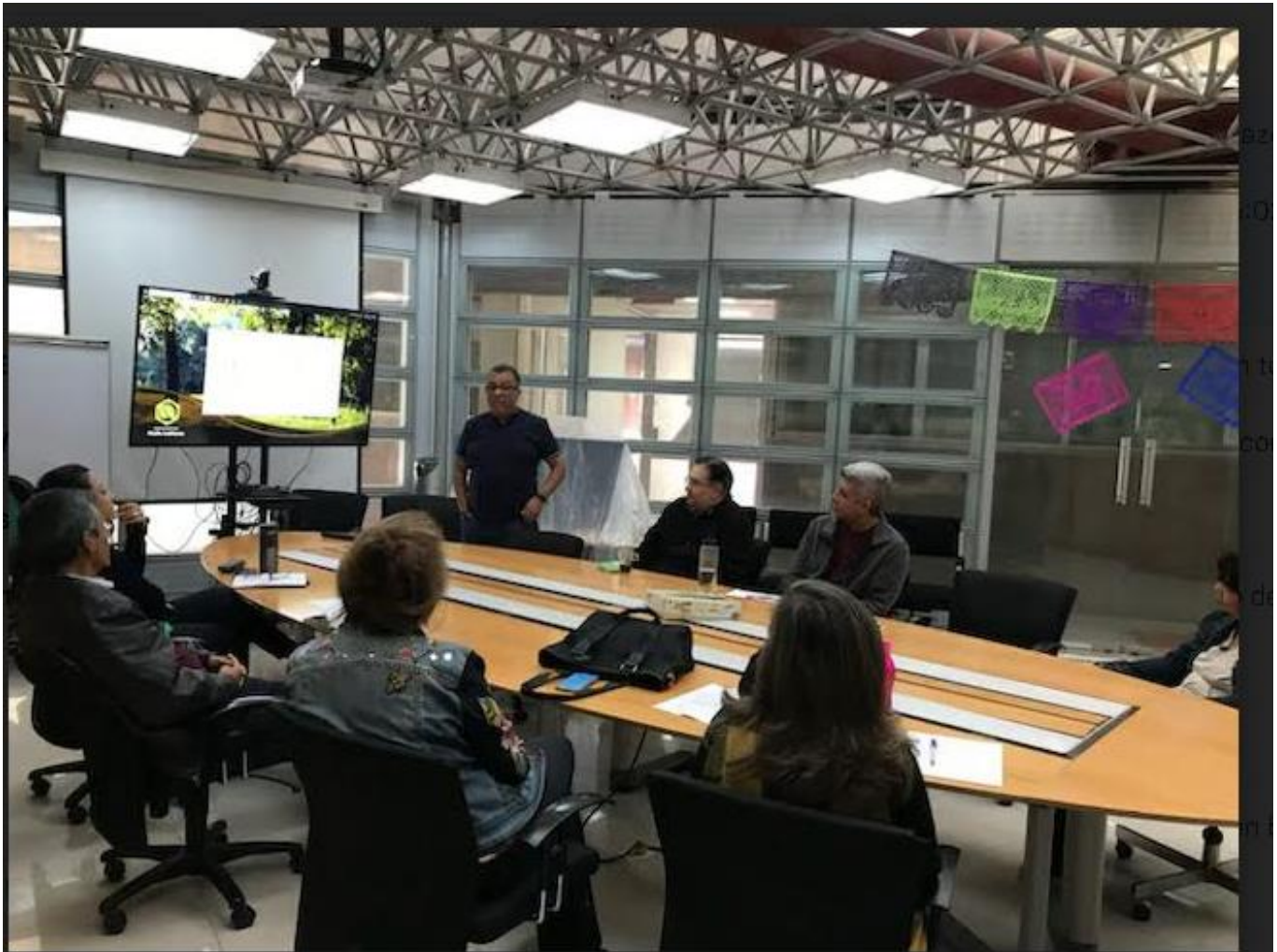
Temática de la UEA Diseño de mensajes gráficos II (signos tipográficos) - Está usted recibiendo a