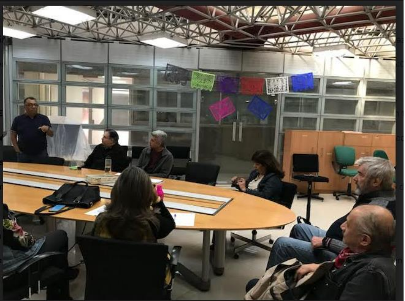
Temática de la UEA Diseño de mensajes gráficos II (signos tipográficos) - Está usted recibiendo