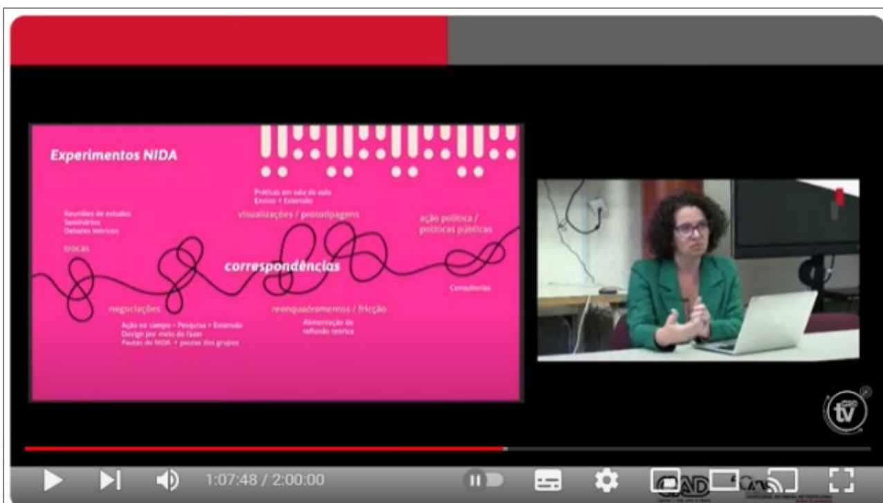
2da Jornada de Diseño Disruptivo

CyADtv 7.81 K suscriptores Suscrito 5 Compartir