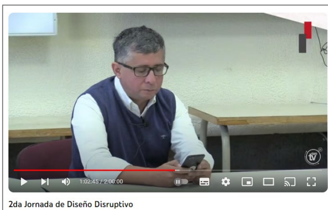
2da Jornada de Diseño Disruptivo