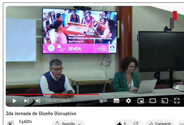
2da Jornada de Diseño Disruptivo

CyADtv 7.81 K suscriptores Suscrito 5 Compartir