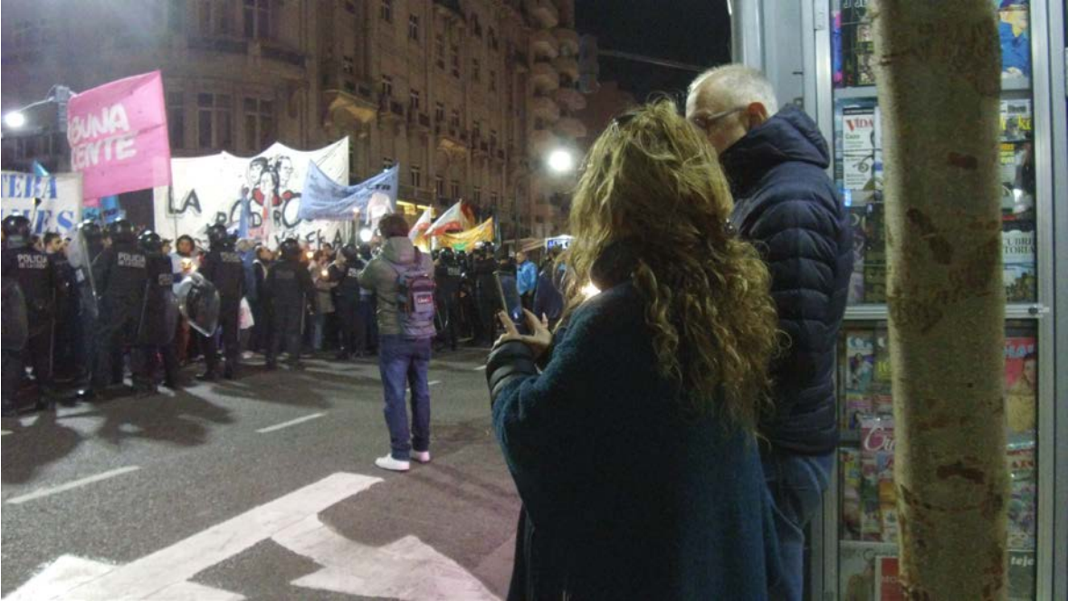
Las capas Geografía urbana Guión, realización y edición del video titulado Las capas Geografía urbana